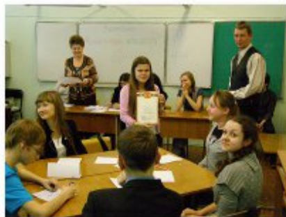
15 марта - Международная математическая игра "Кенгуру" для учащихся 2-10 классов