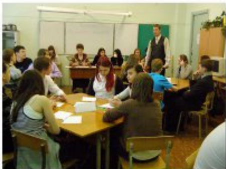
14 марта - викторина «Математический калейдоскоп» для учащихся 8-х классов