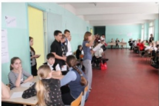
16 марта - Игра для учащихся 5-х классов