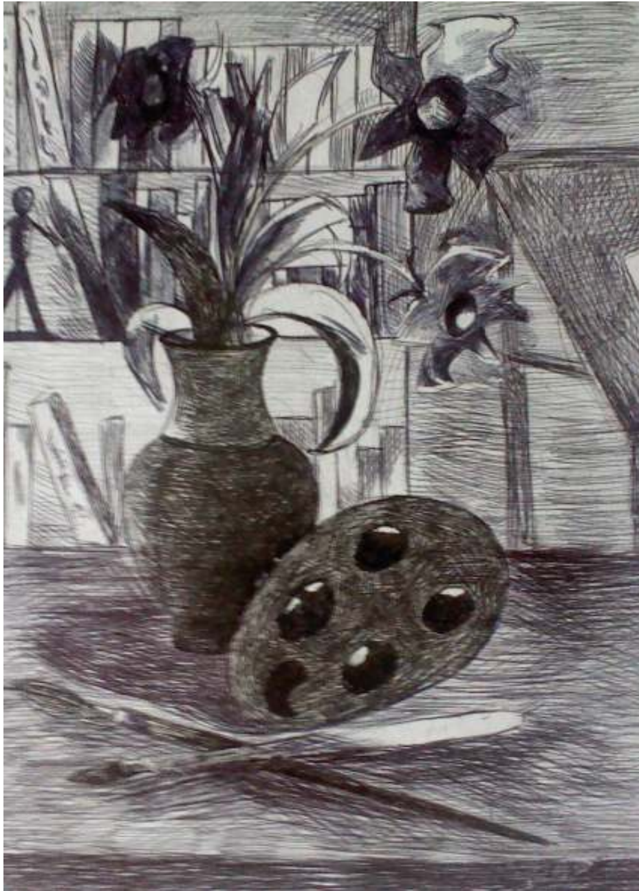
Надежда Деркач 7Б