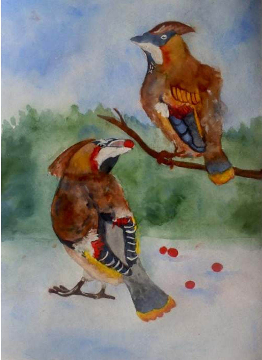
Тамара Сапрыкина 5Б