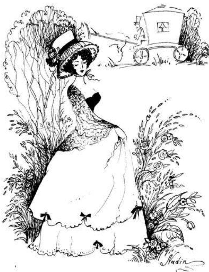
Рисунок Н.Г. Щербуняевой