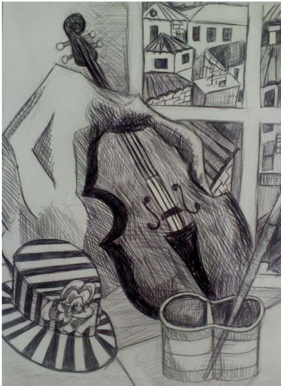
Анастасия Ян 7Б