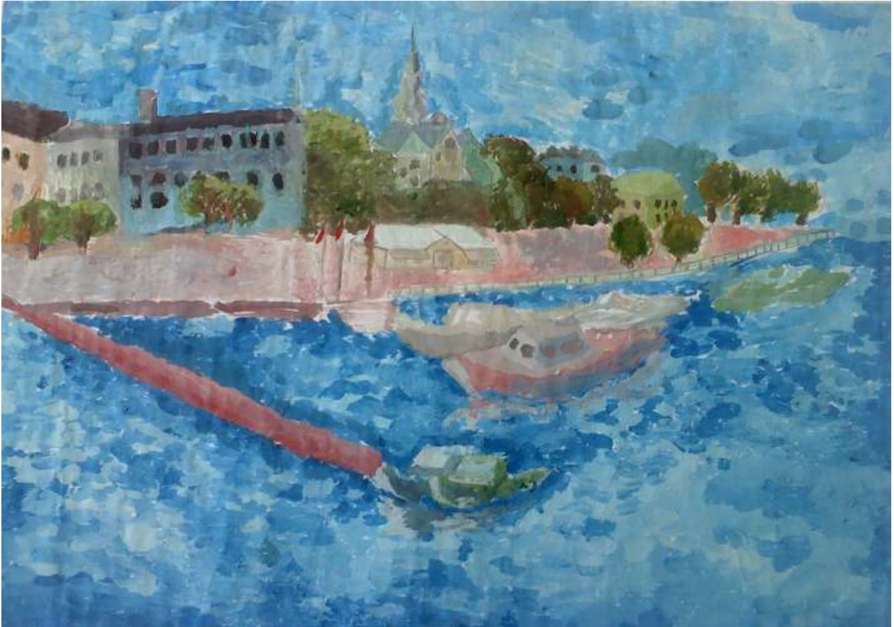
Нурсия Летифова 8Б