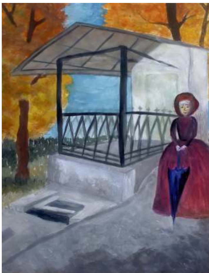
Ульяна Усердова 8В

Компания с восторгом смотрела на эти беседки, ротонды, павильоны, на розы, выращенные среди леса на скалах и вокруг источника Сильмии, вообще на огромное количество цветов в этом северном краю. Она взбиралась на восхитительные китайские мостики в виде легких ажурных вееров – и сердца их переполняло любовью к красоте и жизни.