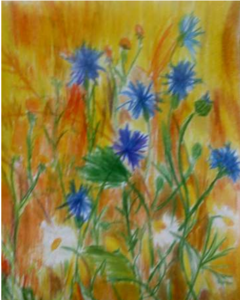
Вера Вередюк 5В