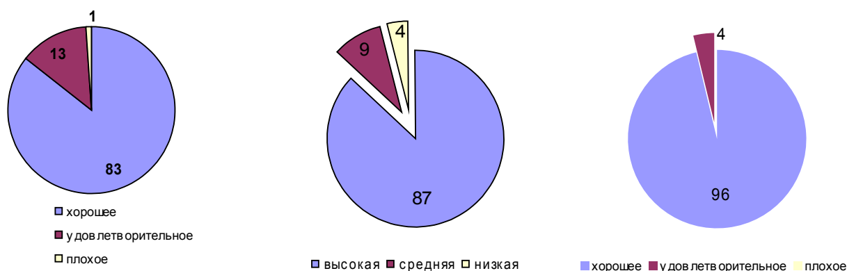
Диаграмма 1 «Самочувствие» Диаграмма 2 «Активность» Диаграмма №3 «Настроение»

Диагностика: изучение комфортности учащихся в школе по методике «Самочувствие. Активность. Настроение.»